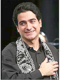
کنسرت نوروزی همایون شجریان و سهراب پورناظری در آمریکا

رضارویگری بازیگر با سابقه سینما، تئاتر و تلویزیون در خصوص آخرین وضعیت جسمانی خود گفت: در حال حاضر برای درمان به فیزیوتراپی می‌روم. پیش‌تر فیزیوتراپی در آب را امتحان کرده بودم که به شدت جواب داد و اگر دوباره روند آب درمانی را آغاز کنم مطمئنم که یک ماهه خوب خواهم شد. بازیگر سریال «مختارنامه» در خصوص پیشنهادات سینمایی و یا تلویزیونی افزود: پیشنهاد خاص که هیچ پیشنهاد عام هم ندارم. در سینمای امروز مشخص است که نقش‌ها به چه کسانی می‌رسد. من جزء رفیق و فامیل دست‌اندرکاران سینما نیستم و به همین دلیل کسی مرا نمی‌بیند. من بازیگری هستم که مردم را دوست دارم و می‌خواهم برای آنها بازی کنم. وی با اشاره به علاقه خود برای بازگشت به بازیگری ادامه داد: چندین بار شرایط و پیشنهاداتی برای حضور در خارج از کشور و بازی در سایر شبکه‌های خارجی داشتم اما هیچ‌گاه آنها را نپذیرفتم زیرا من عاشق این خاک و مردمم هستم.