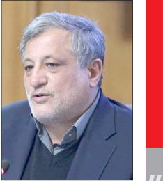
محسن هاشمی: با انتقال پایتخت ماخلیم

رئیس شورای اسلامی شهر تهران با اشاره به برگزاری جلسه‌ای با معاون اول رئیس‌جمهور با موضوع «انتقال پایتخت» گفت که مدیریت شهری با این موضوع مخالف است. محسن هاشمی در خصوص نظر مدیریت شهری در ارتباط با انتقال پایتخت با تاکید بر اینکه با این انتقال مخالف هستیم، افزود: قطعا هزینه‌هایی را که می‌خواهند برای انتقال پایتخت بپردازند، بهتر است به تهران اختصاص دهند تا بتوانیم تهران را ساماندهی و درست کنیم. رئیس شورای اسلامی شهر تهران، ادامه داد: هر دولتی که در گذشته اداره امور را در دست گرفته، در خصوص انتقال پایتخت مطالعاتی را انجام داده و هزینه‌ای نیز در این رابطه پیش‌بینی کرده بود. اما نظر ما این است که هزینه پیش‌بینی شده به خود تهران اختصاص پیدا کند تا بتوانیم مشکلات آن را حل و فصل کنیم.