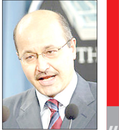
برهم صالح: روابط خوب ما با ایران به نفع همه است

ایسنا: برهم صالح، رئیس‌جمهور عراق در گفتگو با رسانه‌های عراقی در رابطه با سفر حسن روحانی، رئیس‌جمهور ایران به عراق گفت: سفر روحانی، رئیس‌جمهور ایران به بغداد سفر مهمی خواهد بود. من پیش از این به تهران سفر کردم و گفتگوهای عمیقی در رابطه با مسائل متعدد با مقامات ایرانی داشتم. وی افزود: روابط ما با ایران بسیار مهم است، به تمام کشورهای که به آنها سفر کردم اعلام کردم که منفعت عراق در این است که روابط بسیار خوبی با ایران داشته باشد و من به عمد این عبارت را تکرار می‌کردم و می‌گفتم که منفعت عراق به این است که چنین روابطی را تداوم دهد. برهم صالح گفت که ما با ایران ۱۴۰۰ کیلومتر مرز مشترک داریم همچنین میان دو ملت اشتراکات فرهنگی و اجتماعی وجود دارد.