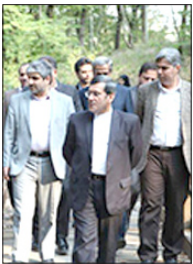
نشستی با حضور مشاور وزیر امور خارجه در شهر همدان