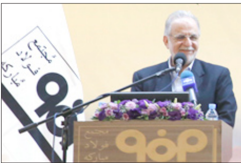
شاکر و امیدوارم که بتوانم با قدرتی از این فرصت به نحو شایسته پاسخگوئی این اعتماد باشم.

مهندس عظیمیان رشد و بالندگی فولاد مبارک را حاصل